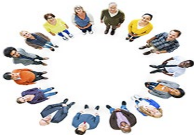
Lema "Unida en la diversidad"