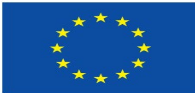
La bandera europea