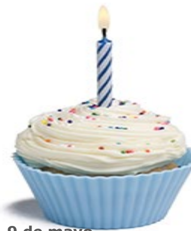
Día de Europa, 9 de mayo