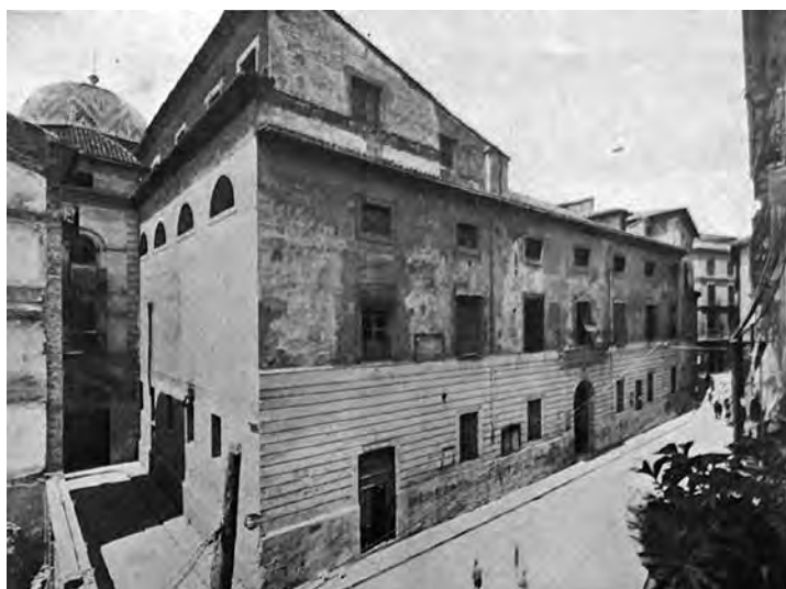
Fig. 6.- Fachada de la Casa Profesa a la calle de la Purísima, antes del comienzo del derribo..