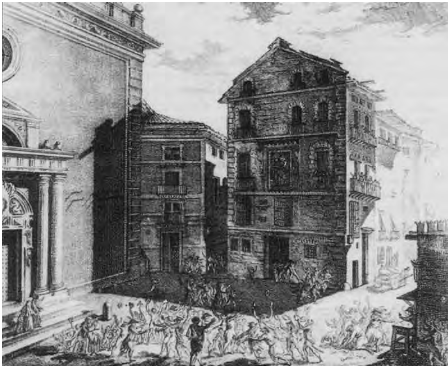
Fig. 5.- Grabado de Vicente y Tomás López Enguïdanos que muestra la fachada de la iglesia de la Compañía y un fragmento de la Casa Profesa en 1808 (Valencia, 1810).