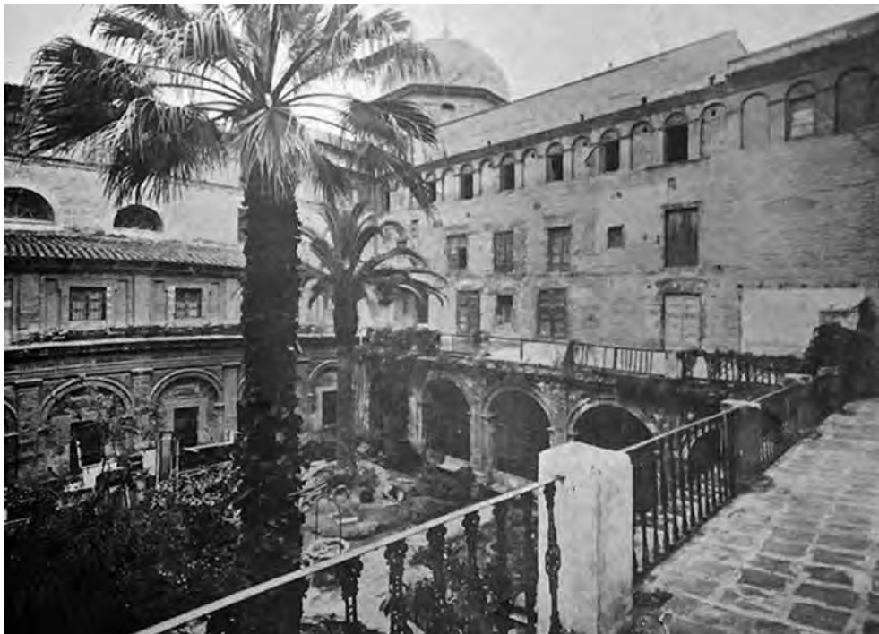
Fig. 3.- Claustro principal de la Casa Profesa, antes del comienzo del derribo.