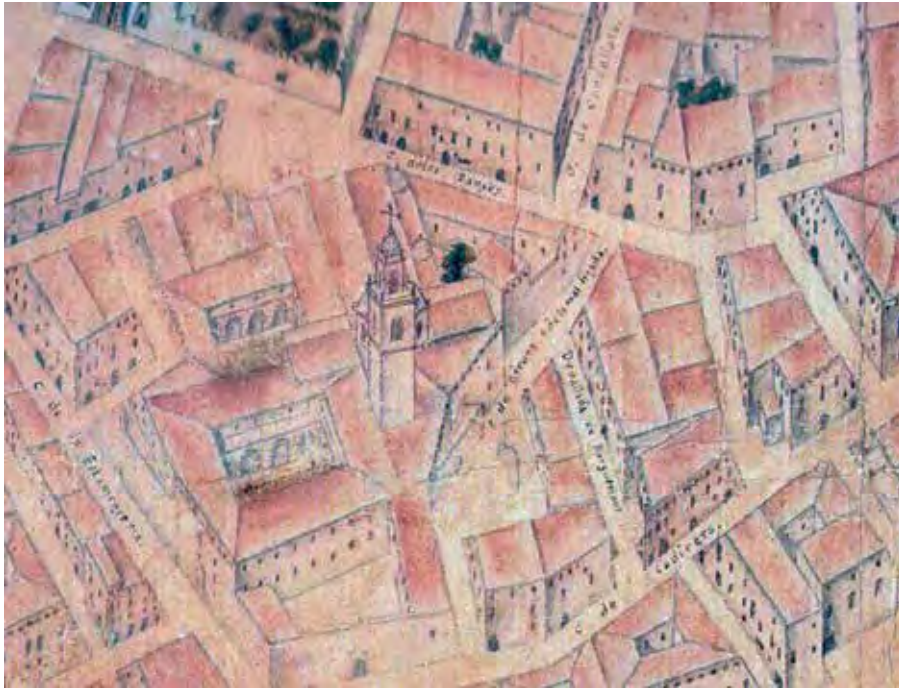
Fig. 4.- Vista de la Casa Profesa en el de plano de Valencia de Tosca (1704). Museo Municipal, Ayuntamiento de Valencia.