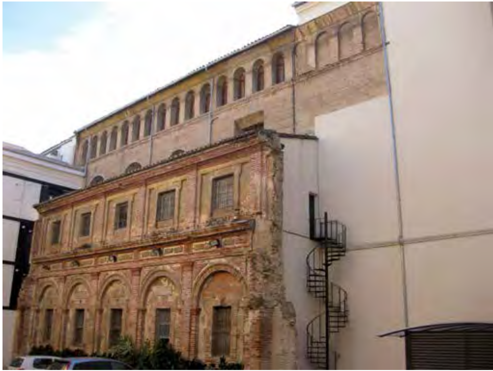
Fig. 2.- Cuerpo conservado de la Casa Profesa que incluye la panda meridional del claustro.