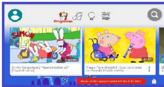
Figura 1. Captura de pantalla de Youtube Kids

Youtube Kids posee una interfaz gráfica para dispositivos móviles diseñada para un fácil acceso y navegación para los infantes. Es una interfaz muy atractiva y estimulante para los infantes ya que es una App donde pueden navegar libremente (Streck, 2017). Presenta con iconos representativos como botones del menú principal localizados en la parte superior de la pantalla (Figura 1).