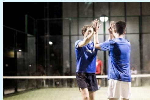
Jugadors celebrant un quinze.