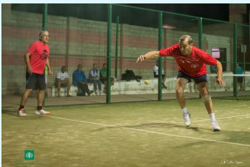
I Circuit Intercomarcal de Màdel.