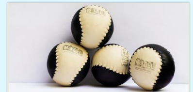
Pilotes de màdel.