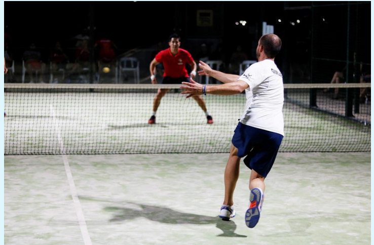
Jugadors jugant una partida al passat circuit.