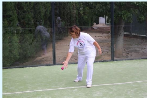
Practicant del CRIS I CDD Sant Pau.

La pilota utilitzada és la pilota de màdel, dissenyada específicament per al joc, tova, entre 40 i 42 grams amb un bot més reduït i amb un diàmetre més gran.