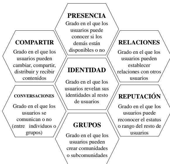
Figura 1. El panal de las características de los medios sociales

Desde otra perspectiva, autores como Kietzmann et al. (2011) indican que las discrepancias conceptuales sobre lo que son y no son los medios sociales y las diversas formas que estos pueden tomar, son probablemente una de las principales causas que provocan que una parte importante de gestores y ejecutivos no sean capaces de sacar todo el rendimiento posible al potencial que ofrecen los medios sociales. Con el fin de superar dichas limitaciones teóricas y facilitar la identificación respecto a qué herramientas comunicativas son medios sociales y cuáles no, así como entender su naturaleza, los autores proponen un modelo teórico plasmado en un diagrama en forma de panal de abeja, en el que se definen los medios sociales mediante siete características que pueden estar presentes, en mayor o menor medida, en cada medio social: identidad, conversaciones, compartir, presencia, relaciones, reputación y grupos, tal y como se puede observar en la Figura 1.